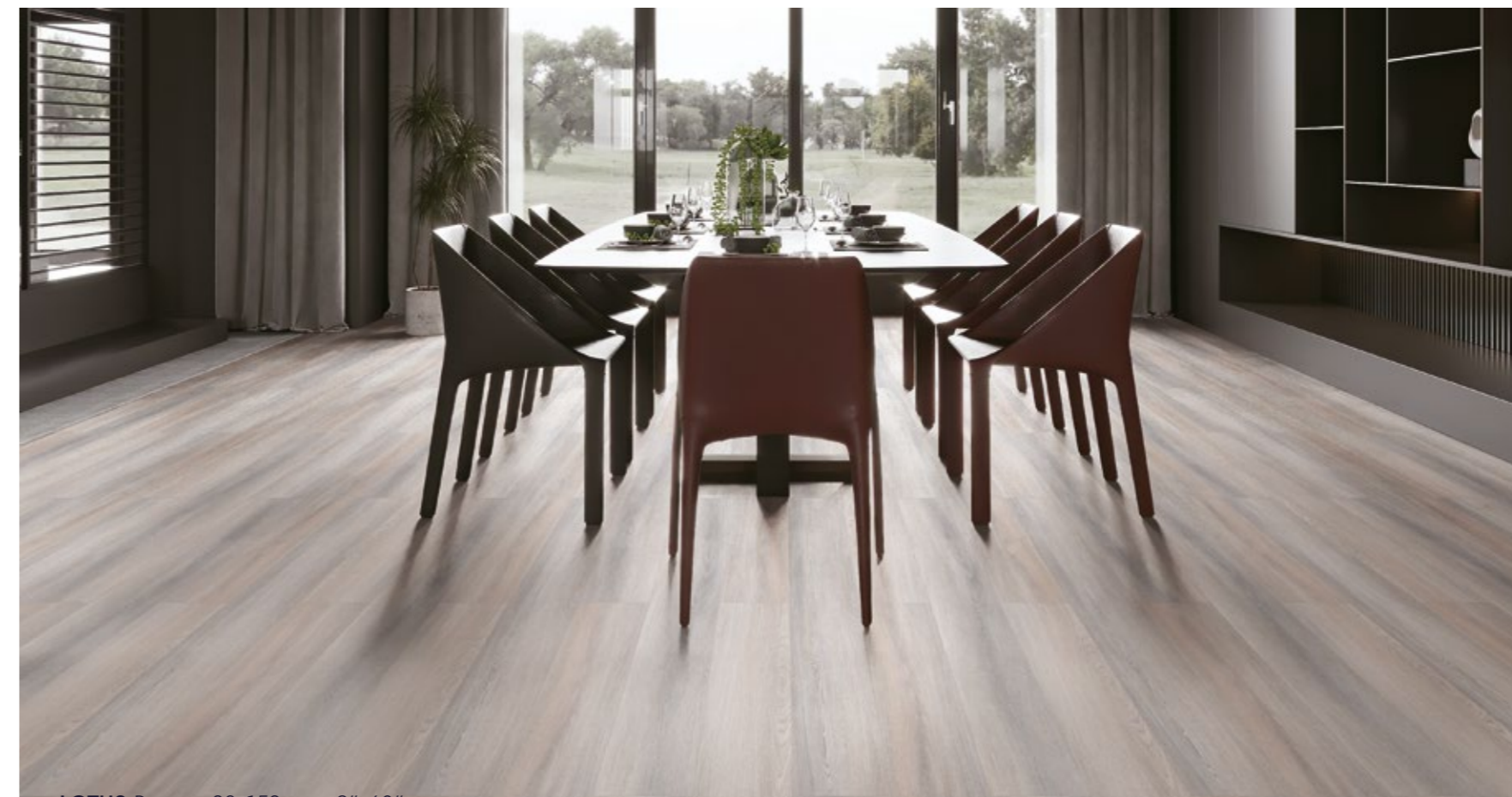
LOTUS Rusteze 23x152 cm · 9"x60"