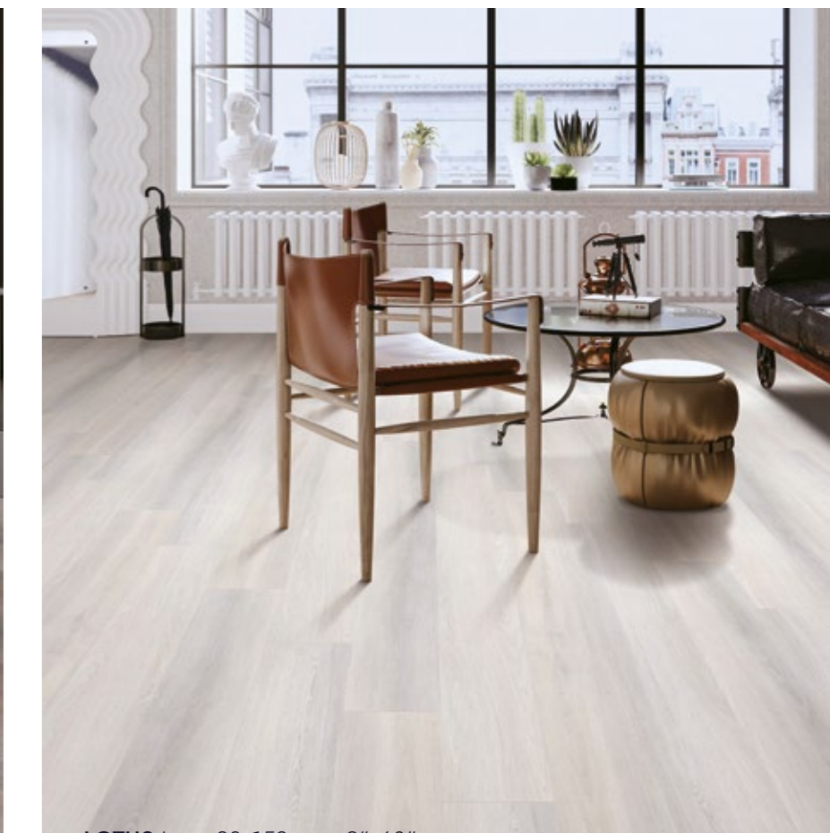
LOTUS Ivory 23x152 cm · 9"x60"