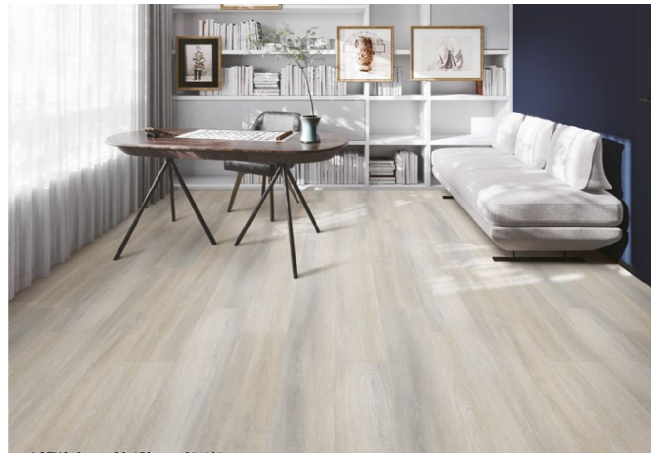
LOTUS Crema 23x152 cm · 9"x60"