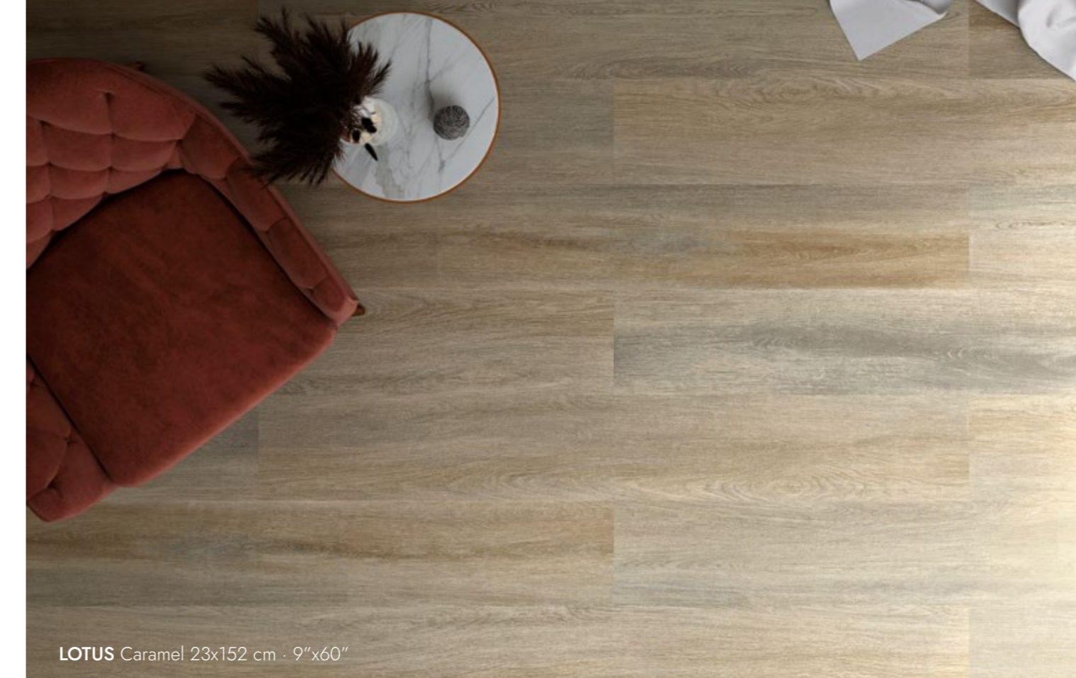
LOTUS Caramel 23x152 cm · 9"x60"