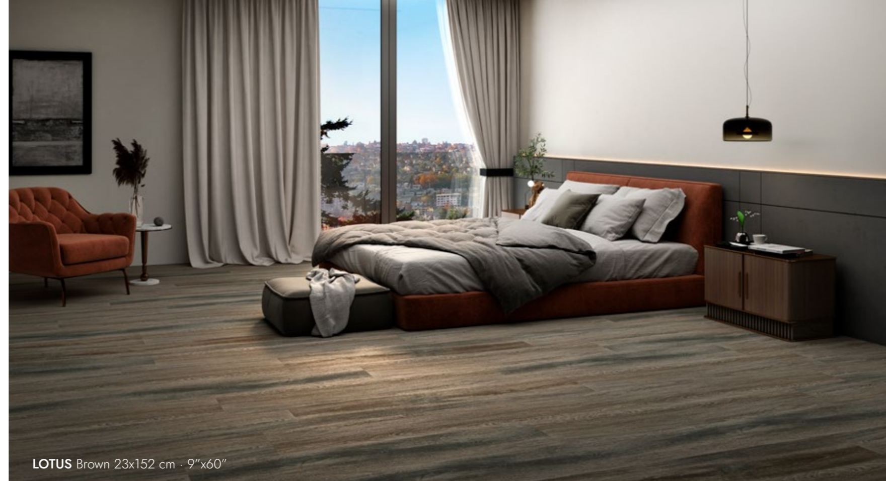
LOTUS Brown 23x152 cm · 9"x60"